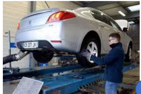
contrôleur technique automobile